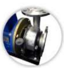
Поворотный корпус насоса