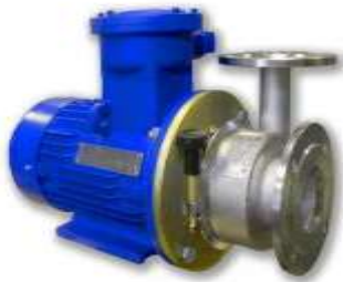
Насос КМ 80-65-140 Е