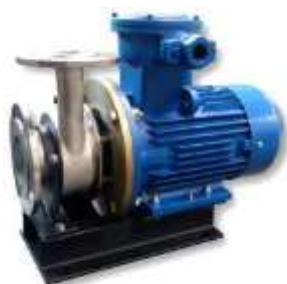
Насос КМ 80-65-140 Е на раме